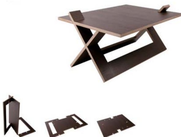
3. attēls. Saliekams kafijas galdiņš. Dizains: Kaspars Jursons ( http://www.directdesign.lv/#/works/furniture/staklis-collection/ )

Latvju zīmes kā pievienotā vērtība ir arī dizainera Anda Krivma veidotajām āra mēbelēm. Tās izgatavotas no priedes vai egles masīvkoka, neizmantojot skrūves vai naglas (skat. 4. att.).