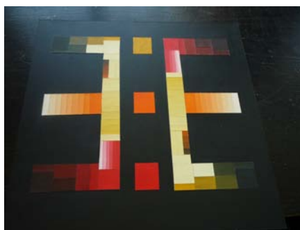
12. attēls. Etnogrāfijas zīmes radoša interpretācija

Studijuursos „Mākslas valoda un kompozīcija” (skat. 12. att.) un „Telpas uztvere un koloristika” (skat. 13. att.), darbojoties ar ornamentiem un rakstu zīmēm, studenti veic tēlainās un strukturālās izteiksmes meklējumus, kuru iespējas savā grāmatā V. Celms (2011) apraksta šādi: raksta struktūras, kas atrodamas seno audumu veidos ir pašvērtīgas. Tās iespējams palielināt vai samazināt neatkarīgi no sākotnējās saistības ar konkrētu priekšmetu vai materiālu. Struktūras palielinājums dot iespējas papildus darbībām, kas interpretē vai raksturo šo struktūru, piemēram: mēroga palielināšana, telpiskuma un kustības ieviešana, grafiski lineāro principu papildināšana ar gleznieciski tonālajiem triepieniem, materiālu un gaismas sajūtu izteiksmēm, krāsu salikumu saskaņu un disonansi, mākslinieciski tēlainās izteiksmes paņēmieniem, asimetrijas ieviešana simetrijā un sakārtotībā, dažādas stilistikas pieļāvumi un dinamiska maiņa jeb kārtība un nekārtība kā mērs, jaunas simbolikas strukturēšana telpā, kas atvērusies, palielinot zīmes mērogu (krāsa kā simbols, formas kā simbols u.c.).