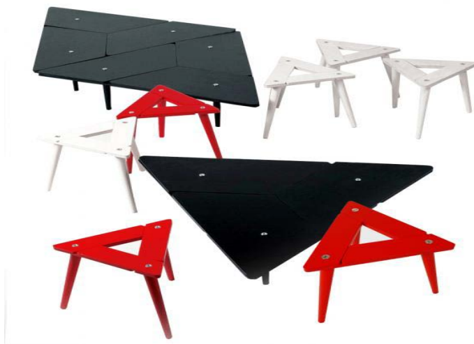
2. attēls. Galdu un ķebļu komplekts. Dizains: Elīna Bušmane ( http://www.directdesign.lv/#/works/furniture/staklis-collection/ )