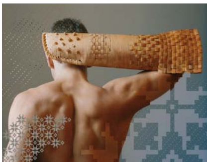
10. attēls. Cimds pirtij. Dizains: Gita Degsne ( http://www.designlv.lv/?parent=623 )

turētājus. Viens no negatīvajiem Jekaterinas secinājumiem, bija tāds, ka, ja šī dāvana ir maināma un papildināma, ir jāpārzina klūgu pīšanas tehniku, kura nav pieejama ikvienam, piebilstot, ka tieši jaunieši nevēlētos nodarboties profesionāli ar klūgu pīšanu, lai veidotu sev grozus rudens ražas glabāšanai. Kopā ar studiju biedriem no klūgām tika izveidots arī specifiska izskata un pielietojuma objekts, kurš izskatās pēc roku sildītāja, bet īstenībā ir putnu barotava, kura, ar gaisā paceltu roku to pakratot, izdod skaņas, kuras it kā pievilina putnus. Ievērojams klūgu darbs bija dizaina izstrādājums - masāžas cimds, kurš paredzēts lietošanai pirts rituālos (skat. 10. att.).