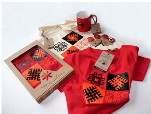
1. attēls. Uzņēmuma SIA Nice Place produkcija

Tā, piemēram, ar suvenīru ražošanu un izplatīšanu nodarbojas uzņēmums SIA Nice Place (skat. 1.att.). Informācijā par sevi viņi raksta: „Mēs veidojam suvenīrus, kas cilvēkiem atgādinātu vai stāstītu par Latviju. Turklāt šajos suvenīros mēs cenšamies parādīt Latviju tādu, kādu mēs paši to jūtam un redzam. Skaistu, sirsnīgu, dažādu un jauku.”