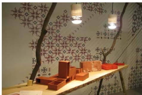
9.attēls. Ekspozīcija „React!” ( http://www.designlv.lv/?parent=623 )

Kā spilgts piemērs šeit ir Latvijas Mākslas akadēmijas Dizaina nodaļas dalība (jau 7.reizi) Stokholmas mēbeļu meses jauno dizaineru darbu izstādē Greenhouse . Ekspozīcija ar nosaukumu „React!” atklāja, kā Latvijas jaunie dizaineri izprot savu piederību tradicionālajai amatniecībai, kādu redz etnogrāfiju un tautas identitāti laikmetīgā kontekstā un turpinājumā. Demonstrējot izstādi „React!” Latvijas publikai, interesenti tika aicināti uz neformālu sarunu par dizainu un amatniecību, roku darbu un mūsdienu latviskumu. Šajā diskusijā piedalījās un savus vērojumus apkopoja arī Rēzeknes Augstskolas (RA) docētāji un studenti.