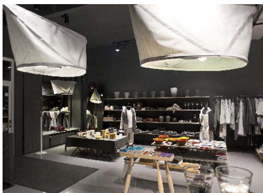
8. attēls. Dizaina veikals RIIJA ( http://www.rijada.lv/ )

Mūsdienu latviešu dizaina esence vienuviet rodama latviešu dizaina un dzīvesstila veikalā RIIJA (skat. 8. att.). Jau pasaulē atzītu vietējo dizaineru darbi un spožākais amatnieku veikums visplašākajā Latvijas ģeogrāfijā. Estētiski skaisti, mūsdienīgi un vienlaikus funkcionāli mājas un sadzīves dizaina priekšmeti, kuru dizaina koncepts ir latviešu amatniecības tradīciju turpinājums, taču jau ar laikmetīgas pasaules sajūtu. Veidojot veikala piedāvājumu, RIIJA komanda savā ziņā, darbojušies kā mākslas izstāžu kuratori, atrodot labāko un unikālāko katrā no Latvijas reģioniem.