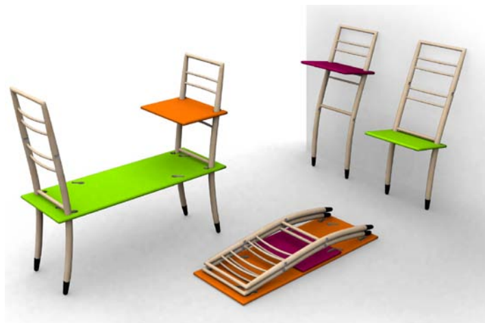
7. attēls. Modulārā sēdmēbele "Latviešu krēsls". Dizains: Mārtiņš Vītols ( http://www.lma.lv/downloads/lma_magistranti.pdf )

Rotu dizainā, izmantojot etnogrāfijas un arheoloģijas izpētes materiālus, darbojas Gundars Pekelis, Inita un Vitauts Straupes, Daumants Kalniņš, Tālis Kivlenieks u.c.