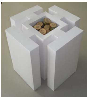
14. attēls. Stikla galda pamatnes makets. Dizains: Mārīte Elksne

Ieviešot latvju zīmes apkārtējā vidē, topošo dizaineru uzdevums ir novērtēt kā ornamenti organizē vidi un ievirza domāšanu. Harmonija, kārtība, disciplīna, kas ir ornamenta būtība ir jānodrošina pašā dzīvē, cilvēkos un vidē. Ornamentālo zīmju un struktūru vērtība atklājas, tās ilgstoši vērojot, apcerot un meditējot. Tās ir kā atslēgas un attīstības programmas mūsu latviskai mākslai, videi un garam (Celms, 2011).