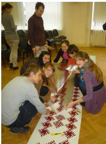
15. attēls. Top RA aktu zāles noformējums 18.novembra svētku pasākumam

Būtisks iemesls valstiskās un tautiskās simbolikas izpētei ir noformējumu veidošana gadskārtu un valsts svētkiem Rēzeknes pilsētvidē un RA telpās. Šādi uzdevumi ir paredzēti studiju kursā „Interjera projektēšana un ergonomika (mākslinieciskā noformēšana)”. Katrs students individuāli izstrādā skices, ko izvērtē docētājs. Piedāvājumu, kurš atbilst īstenošanas kritērijiem, studenti realizē kopīgi (skat. 15. att.).