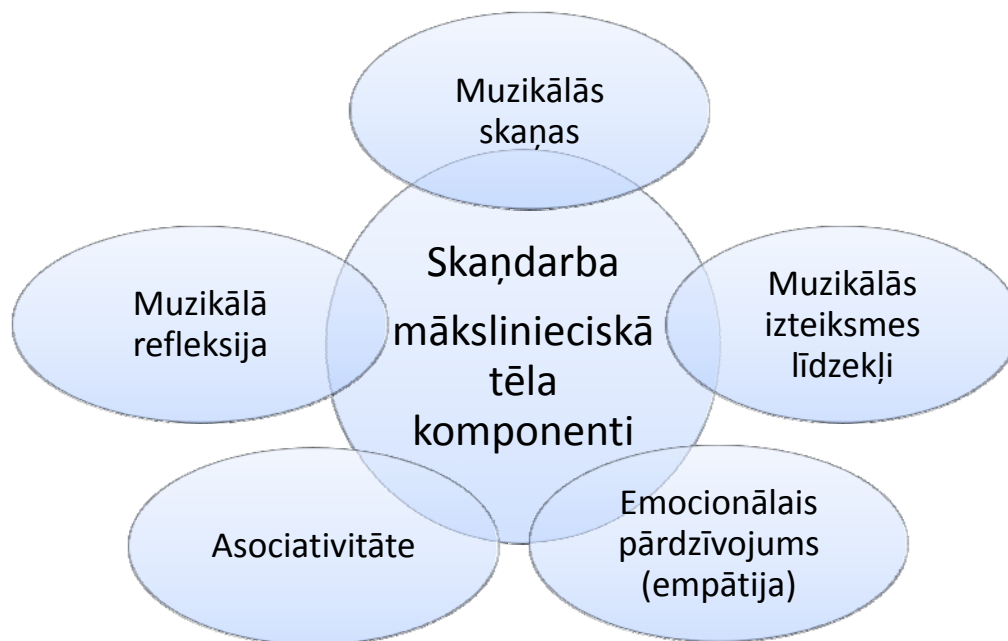
2.attēls. Skaņdarba mākslinieciskā tēla komponenti (Marčēnoka, 2012)

un definēt mākslinieciskā tēla jēdzienu kā radošās iztēles produktu, kam piemīt šādas galvenās iezīmes: emocionālais pārdzīvojums (empātija), spilgts asociatīvais priekšstats un muzikālā refleksija.