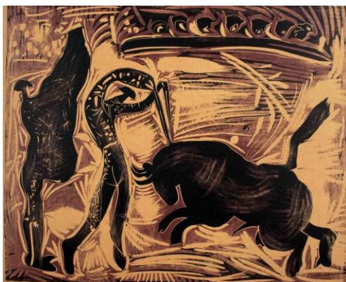
4. attēls. Pablo Pikaso. Le Banderillero, 1959, krāsains linogriezums

Kā otro tēmu, kuru mākslinieks aizsācis jau agrā jaunībā, var minēt vēršu cīņu atainojumu (skat. 4. att.).