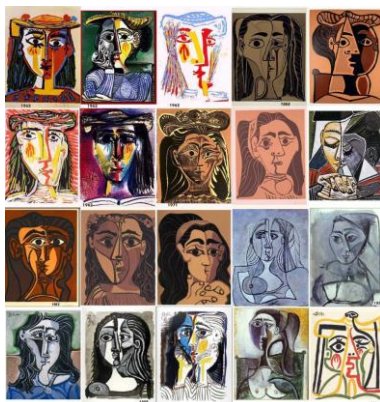
2. attēls. Pablo Pikaso. Žaklīnas Rogue portreti, 1962, krāsains linogriezums

Analizējot Pikaso linogriezuma grafikas tehnikas darbus, tajos var sastapties ar ļoti daudziem un dažādiem portretiem (skat. 2. att.), dubultportreti un grupu portreti.