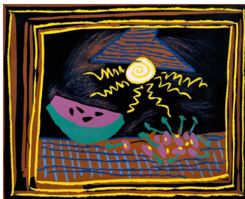
5. attēls. Pablo Pikaso. Klusā daba ar arbūzu, 1962, krāsains linogriezums ( http://www.masterworksfineart.com/inventory/3538 )

Salīdzinot ar citiem žanriem, kādos Pikaso ir strādājis linogriezuma tehnikā, tad var teikt, ka viņš īpaši daudz laika nav veltījis klusu dabu kompozīcijām . Klusās dabas kompozīcija aplūkojama nākamajā attēlā (skat. 5. att.).