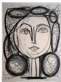
1. attēls. Pablo Pikaso. Fransuaza, 1946, litogrāfija ( http://www.blogmuseupicassobcn.org/2011/05/exploring-lithography-through- )

Pikaso patika eksperimentēt, nepārtraukti attīstīt savu māksliniecisko varēšanu, un viena no tehnikām, ar kuras palīdzību viņš tika pie daudziem atklājumiem, bija litogrāfija (skat. 1. att.).