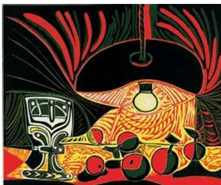
7. attēls. Pablo Pikaso. Klusā daba ar glāzi zem lampas, 1962, krāsains linogriezums

Savukārt klusās dabas kompozīcija, kas parādīta sekojošā attēlā (skat. 7. att.), pētījuma autorei deva „ atspēriena punktu ” – drošas koloristikas, grafiskās izteiksmes un valodas īpatnējā gleznieciskuma izvēlei arī savu individuālo kompozīcijas struktūru izveidei. Šajās kompozīcijās jūtama gaismas un tumsas mijiedarbība, savstarpējā simbioze un sava veida „ īņ un jaņ ” saskarsmes parāde.