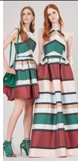
Elie Saab, 2016.

2. Svārku konstrukcija. Taisnstūrveida auduma gabals, kas ir salikts ielocēs, iezīmējot vidukli un radot smilšu pulksteņa siluetu.