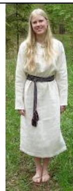
Rekonstruēts arheoloģiskais kreklis.

( http://beainabonnet.com/nyfw-ss-2016-report ).