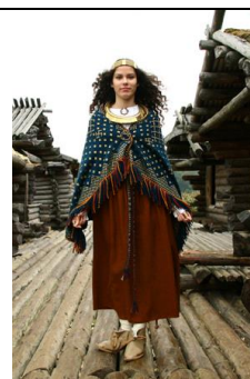
Tautastērpa rekonstrukcija - villaine.