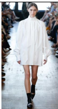
Baum und Pferdgarten, 2016.

4. Krekla konstrukcija. Tunikveida kreklis veido taisnu siluetu. Stāvapakle ar aizdari priekšpusē etnogrāfiskajam kreklam, bet aizdari mugurpusē mūsdienu kreklam. Taisnas, garas piedurknes ar ielocēm aproces daļā un aizdari.