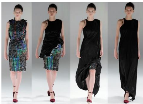
2. attēls. Kolekcijas „Rise” divi vienā kleita.