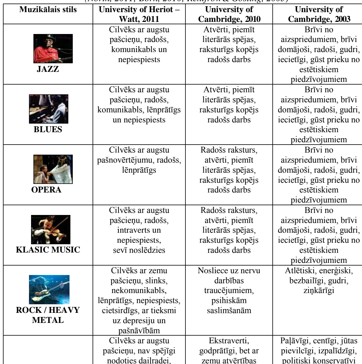
Personības identitātes un muzikālās vēlmju korelācija Correlation of the personality's identity and musical preference (North, 2011; Born, 2010; Rentfrow & Gosling, 2003)