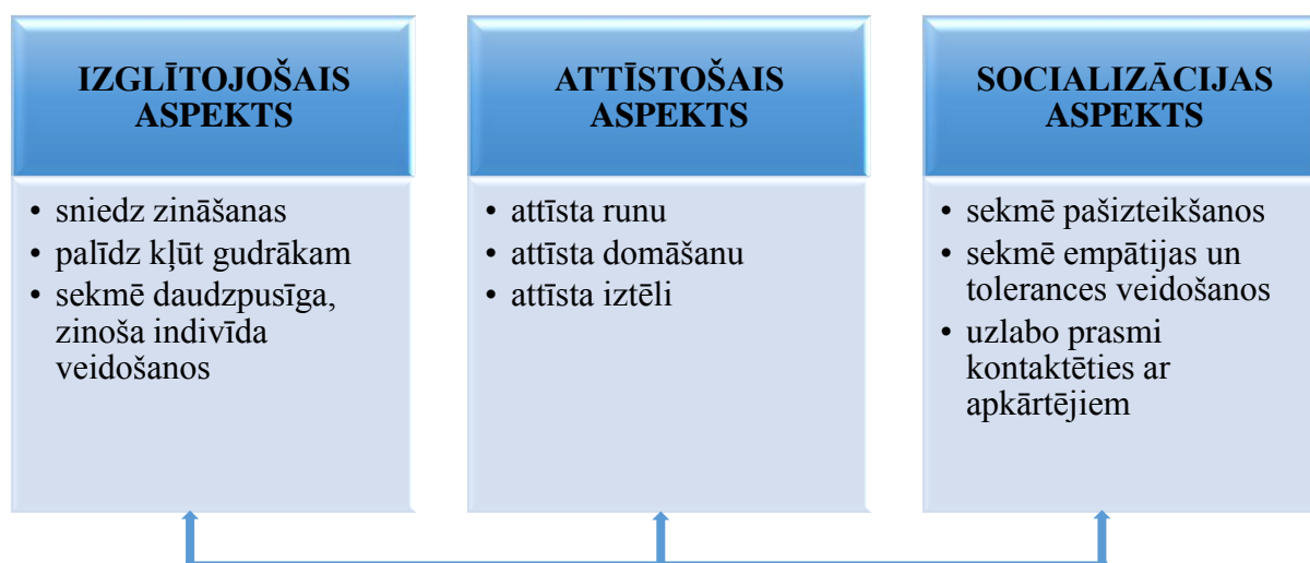
1.att. Lasīšanas ietekme uz sākumskolas skolēna attīstību (vecāku atbildes) Fig.1 The effect of reading on the development of primary school's pupils (parents' answers)

Fokusdiskusija tika organizēta ar mērķi noskaidrot vecāku attieksmi pret lasīšanu. Rezultāti liecina, ka vecāki labi apzinās lasīšanas nozīmi bērna attīstībā. Analizējot un sistematizējot pētāmā materiāla saturu, jēdzieniski tika izdalīti trīs skolēna attīstības aspekti: izglītojošais, attīstošais un socializācijas aspekts (skat. 1. att.)