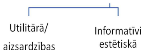
1.att. Apģērba pamatfunkcijas Figure 1 The Basic functions of clothing

Apģērba pamatfunkcijas nosaka tam izvirzāmās prasības (skat. 1. attēlu).