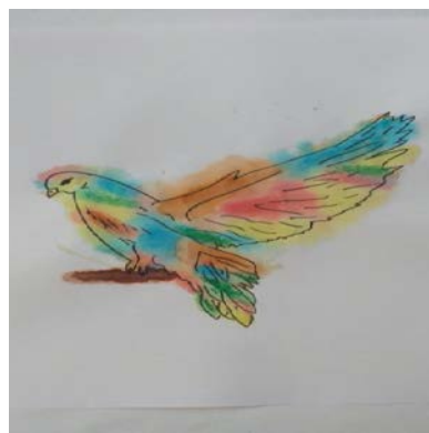
Рисунок 1. Образцы рисунков студентов по результатам выполнения упражнения «Мой образ»