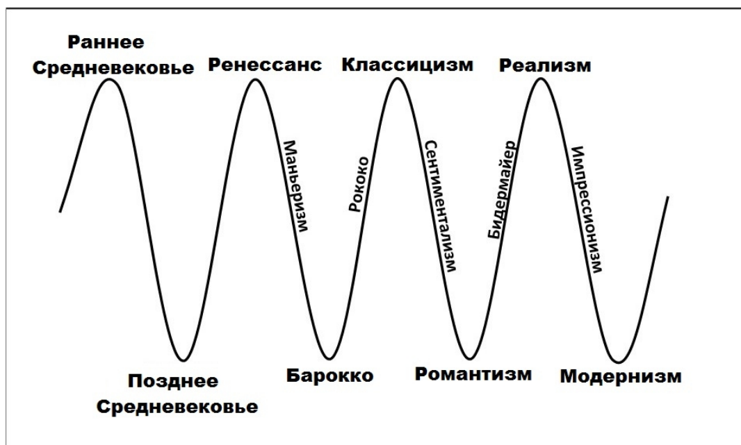
Рис. 1. «Маятник Чижевского»-1 Figure 1 The Chizevski balance wheel-1

В середине 20 в. немецкий славист и философ русско-украинского происхождения Д. И. Чижевский выдвинул культурологическую теорию, получившую название «маятник Чижевского». Как и Ницше, он рассматривал развитие искусства как взаимодействие двух противоположных эстетических полюсов (приблизительно тех же самых, о которых говорил Ницше), при этом Чижевский увидел, что между ними происходит «маятниковое движение».