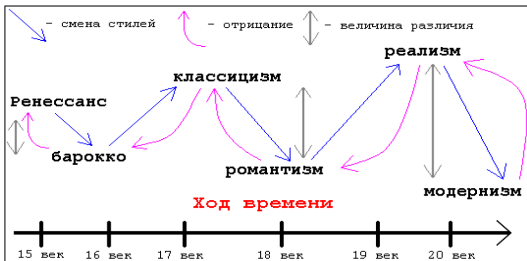
Рис. 2. «Маятник Чижевского»-2 Figure 2 The Chizevski balance wheel-2

Излагая и дополняя теорию Чижевского, В.Г. Власов (2009) подчеркивает увеличение амплитуды колебания между противостоящими парами (исторические стили ренессанс–барокко, классицизм–романтизм, реализм–модернизм): «Ренессанс и барокко противостоят друг другу, но, вместе с тем, между ними существует преемственность и тесное взаимодействие. Классицизм и романтизм исторически взаимосвязаны, однако со временем расходились все дальше; еще больше расстояние между реализмом и модернизмом» (Власов, 2009:24).